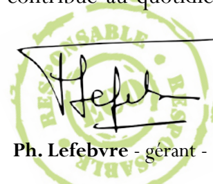
Ph. Lefebvre - gérant -